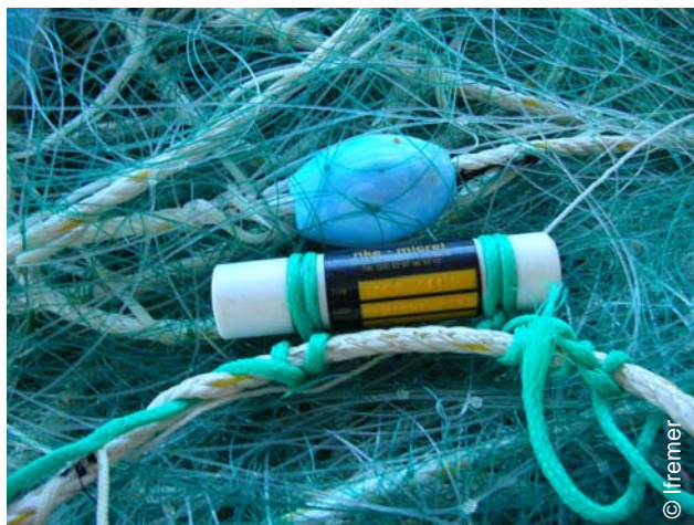
Capteur pression-température monté sur un filet

plusieurs navires de pêche. Autonome 2 et de très faible dimension 3 , il est suffisamment robuste pour être fixé sur tout type d'engins de pêche, qu'il soit traînant (chalut, drague) ou dormant (filet, palangre, casier). La sonde enregistre les paramètres au cours de chaque phase de l'opération de pêche (descente, action de pêche, remontée de l'engin) selon un pas de temps paramétrable en fonction des engins et de leur mise en œuvre. Elle permet ainsi de constituer des séries et profils de température et prochainement de salinité. La profondeur d'immersion maximale du capteur varie selon les versions de 300 à 1200 mètres.