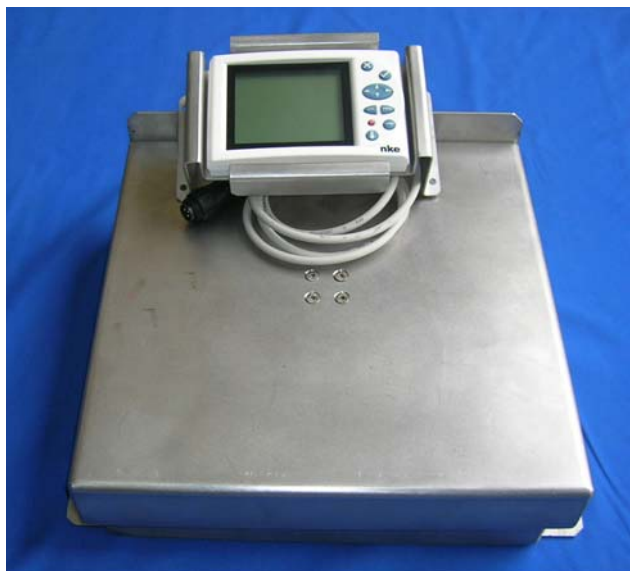
Balance anti-roulis Recopesca