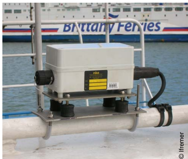
Concentrateur de données fixé à bord

Ce concentrateur compact 6 , héberge également le GPS. Il reçoit les données des capteurs et du GPS, puis les transfère à l'Ifremer pour stockage en base de données. La transmission automatique de l'information a lieu via le réseau GPRS, dès lors que le navire se trouve à portée du réseau téléphonique, sans aucune intervention.