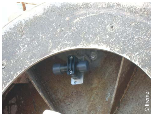
Compte-tour fixé dans un vire-filet